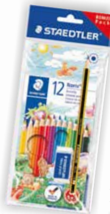
BonusPack Farbstifte 12er + Bleistift + Radierer