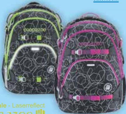
Scale Rale - Laserreflect COOCAZOO