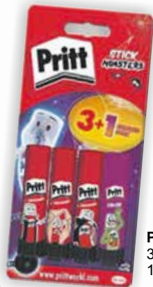
Pritt Klebestift 3+1 3 ST 11g Standard 1 ST 10g Magic

Tel. 09283/1546 info@winterling-rehau.de Ludwigstr. 16 - Rehau