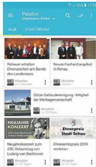
Unser Foto zeigt es anhand der App „Palabre“. Aber es gibt noch viele weitere, die diesen Service bieten...

Damit Sie keine aktuellen Nachrichten der Stadt Rehaus mehr verpassen: Richten Sie sich den RSS-Feed der Stadt Rehaus auf Ihrem Smartphone ein. Mit den entsprechenden Apps erhalten Sie den Hinweis auf neue Berichte und sind immer aktuell informiert. Die Stadt Rehaus informiert mit Berichten über aktuelle Ereignisse, zu bevorstehenden Veranstaltungen und über laufende Projekte auf ihrer Homepage. Damit Sie diese