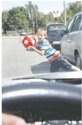
Wenn ein Kind unerwartet auf die Fahrbahn läuft, hilft der Schleuderschutz dabei, das Auto beim Ausweichen sicher zu kontrollieren.

mit ESP ausgestattet. Grundlage für das automatisierte Fahren Weniger Unfälle, weniger Verletzte, weniger Tote - auch der Gesetzgeber hat den Nutzen erkannt und den Schleuderschutz in vielen Teilen der Welt zur Pflichtausstattung gemacht. In der Europäischen Union ist das System seit dem 1. November 2014 für alle neu zugelassenen Pkw und Nutzfahrzeuge vorgeschrieben. Gleichzeitig bildet ESP die Basistechnologie für viele Fahrerassistenzsysteme und das automatisierte Fahren. „Neue und bewährte Technologien warnen und unterstützen den Fahrer in kritischen Situationen, sie können zunehmend eintönige und ermüdende Aufgaben übernehmen. Und vor allem bieten sie so die Chance, die Zahl der Unfälle und Verkehrstoten weiter zu senken“, erläutert Dr. Mathias Pillin, Vorsitzender des Bosch-Geschäftsbereichs Chassis Systems Control. Ob mit oder ohne Fahrer - die intelligente Technik bremst Unfälle auch zukünftig aus.