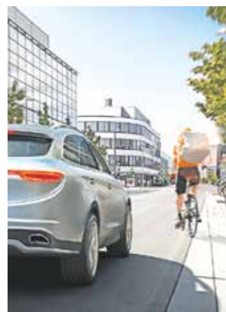
Fußgänger und Radfahrer sind im Straßenverkehr besonders gefährdet. Fahrerassistenzsysteme, die diese Personengruppen schützen, werden daher ab 2022 zur Serienausstattung von Fahrzeugen in der EU.

Jeder neu zugelassene Pkw muss nach EU-Vorgaben ab dem Jahr 2022 serienmäßig mit zahlreichen Fahrerassistenzsystemen für mehr Sicherheit ausgestattet sein. Dazu gehören unter anderem ein Notbremssystem, ein Spurhalteassistent, Sensoren für die sichere Rückwärtsfahrt, eine intelligente Geschwindigkeitsassistent sowie ein System, das den Fahrer bei Müdigkeit warnt. So lange brauchen Autokäufer aber nicht zu warten: Die genannten Helfer sind heute schon verfügbar - in allen Fahrzeugklassen. „Fahrerassistenzsysteme unterstützen den Fahrer in kritischen Situationen und helfen, die Sicherheit im Straßenverkehr zu erhöhen“, sagt Dr. Mathias Pillin, Vorsitzender des Bereichsvorstandes des Bosch-Geschäftsbereichs Chassis Systems Control. Die Systeme