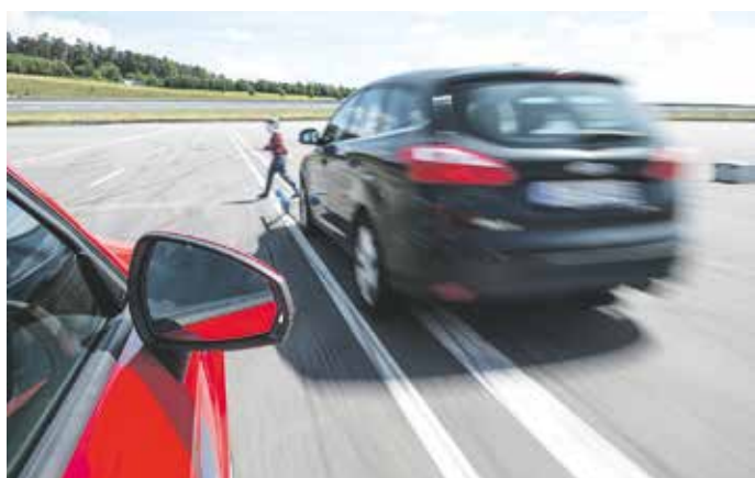
Gefahr erkannt, Gefahr gebannt: Notbremsysteme, die schneller reagieren als der Mensch, können zahlreiche Unfälle im Straßenverkehr verhindern.

Unter den Fahrerassistenzsystemen gelten automatische Notbremsassistenten als besonders wirksam. Seit ihrer Markteinführung 2009 haben sie nach Untersuchungen der Bosch-Unfallforschung allein in Deutschland bis zu 3.000 Unfälle mit Personenschaden verhindert. Ist der Fahrer für einen Augenblick abgelenkt oder tritt plötzlich ein Kind zwischen parkenden Autos auf die Fahrbahn, erkennt das automatische Notbremssystem die Gefahr und berechnet innerhalb von wenigen Millisekunden, wie stark das Fahrzeug abgebremst werden muss, um einen Unfall zu vermeiden. Gleichzeitig warnt das System den Fahrer. Bremsst dieser nicht ausreichend stark, erhöht es selbstständig den Bremsdruck und kann, wenn notwendig, automatisch eine Vollbremsung auslösen.