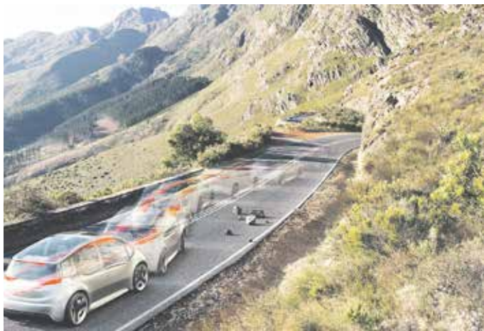
Ausweichen, ohne ins Schleudern zu kommen: Das Elektronische Stabilitäts-Programm hilft dabei, Tausende Unfälle zu verhindern.

Insbesondere auf nassen oder glatten Straßen, beim Auswei-