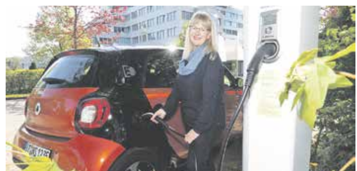
Elektroautos sind das Segment am Automarkt, das künftig am stärksten wachsen dürfte.

18 Anbieter unter die Lupe, die E-Autos in ihrem Portfolio führen. Zur besten Versicherungsoption wurde der „Top Drive Tarif“ der Itzehoer Versicherungen gekürt. Bei E-Autos nicht unwichtig: eine Versicherung von Ladestation und Kabel sowie die Entsorgung defekter Akkus nach einem Totalschaden. Im Tarif des Versicherers aus Schleswig-Holstein ist etwa die Akku-Mitversicherung enthalten.