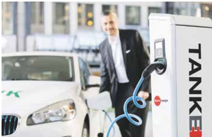
Der Erwerb eines Pkw mit Elektromotor wird vom Staat besonders gefördert.

In der YouGov-Umfrage, die die DEVK in Auftrag gegeben hat, nannten 43 Prozent der Befragten den Schutz der Umwelt als Grund für den Umstieg auf die Elektromobilität. Für 21 Prozent ist zudem der Lärmschutz ein wichtiger Faktor. Knapp ein Fünftel der Umfrageteilnehmer gab die staatliche Umweltprämie als Triebfeder an. Geringere Haltungskosten sind für viele Verbraucher hingegen nicht so ausschlaggebend. Überraschend: Für 33 Prozent der Befragten sprechen überhaupt keine Gründe für den Kauf