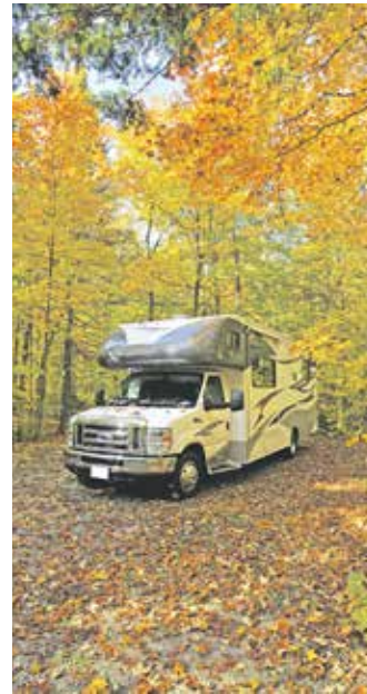
Bevor das Wohnmobil im Winterquartier untergebracht wird, sollten Camping-Fans auch die Gasanlage und den Gasherd auf die Pause vorbereiten.

Neben einer gründlichen Reinigung des Fahrzeugs ist es wichtig, auch an die Gasanlage im Wohnmobil oder Caravan zu denken. Die Gasflasche sollte man am besten herausnehmen und an einem belüfteten, trockenen Platz aufrecht stehend lagern. Vor dem Abtrennen der Flasche muss zunächst das Ventil im Uhrzeigersinn zuge dreht werden. „So vermeidet man, dass Gas austritt“, erklärt Sabine Egidius vom Deutschen Verband Flüssiggas e.V. (DVFG). „Die sehr geringe Restmenge an Gas, die noch in Leitungen und Schläuchen vorhanden ist, kann man hingegen einfach entweichen lassen. Dabei sollte man allerdings gut lüften und darauf achten, dass sich keinerlei Zündquellen in der Nähe befinden.“ Unter www.dvfg.de findet man weitere Tipps zum Umgang mit dem Energieträger. Spätestens zum Saisonende lohnt sich auch ein genauer Blick auf den Zustand der Gasschläuche: Sind