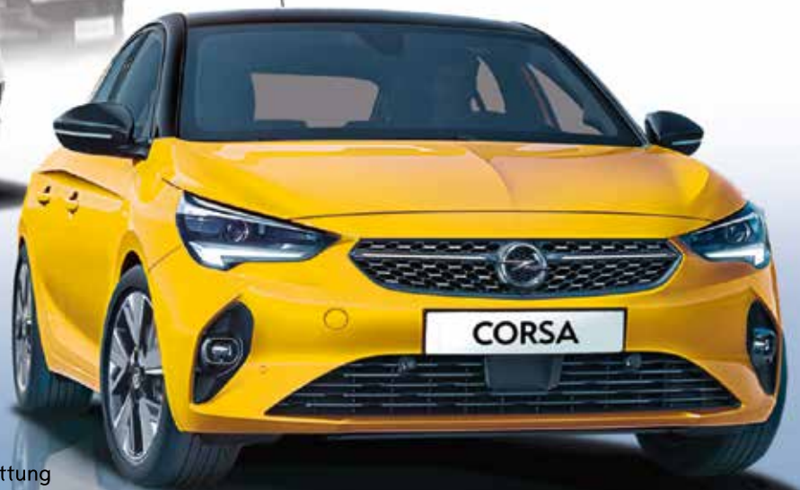
Abb. zeigen Sonderausstattung