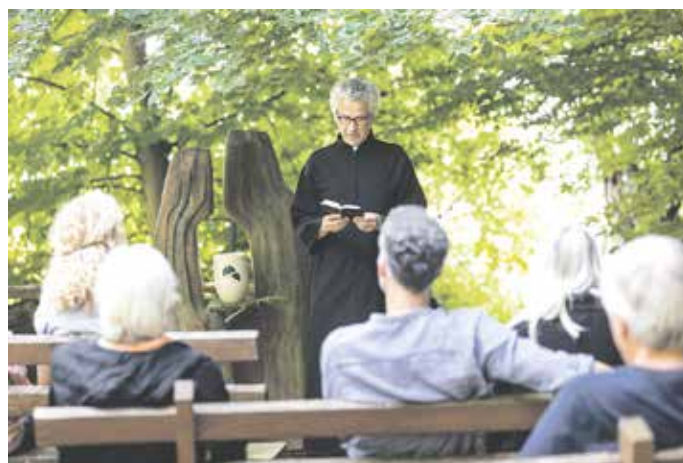
Die Natur steht bei einer Bestattung im Wald im Vordergrund.

Die weinende Verwandtschaft in Schwarz, die sich auf dem Friedhof um das offene Grab eines Verstorbenen versammelt: Dieses Bild gehört in der Vorstellung vieler Menschen offenbar der Vergangenheit an. Bei einer Bestattung wünscht man sich, dass weniger die Trauer im Vordergrund steht, vielmehr soll sie mit positiven Momenten in Verbindung gebracht werden. Das ergab eine aktuelle, repräsentative Onlineumfrage, die das Unternehmen FriedWald in Auftrag gegeben hat. 3.000 Menschen aus ganz Deutschland im Alter von 40 bis 81 Jahren wurden befragt. Und es zeigte sich: Für die meisten, 81 Prozent, ist der Tod ganz selbstverständlich Teil des Menschseins, über den man