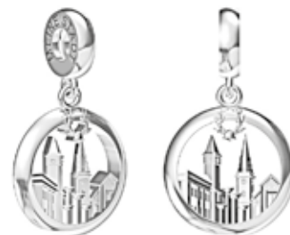
Technische Zeichnung Selb-Anhänger