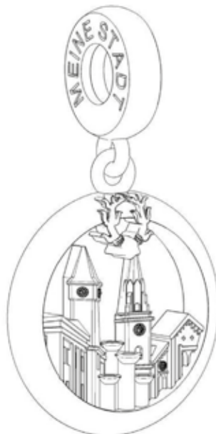
Technische Zeichnung Selb-Anhänger (© Silberkunstwerke)

Außerdem wurde die Öse mit der Beschriftung „Selb“ und „Meine Stadt“ ergänzt.