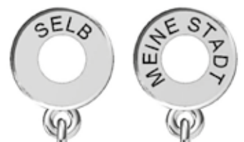
Technische Zeichnung Beschriftung Öse (© Silberkunstwerke)

gegnet. Kulturell bedeutet das für viele – längst nicht alle – eine Rückbesinnung zu bleibenden Werten, jenseits von Smartphone und Social Media. Dinge, die Generationen überdauern und eine emotionale Verbundenheit zum Ort der Herkunft oder Sehnsuchtsort herstellen, sind seit Beginn der Corona-Pandemie vermehrt nachgefragt. Eine besondere Bedeutung spielt dabei auch der Partner des Vertrauens vor Ort: In der Kooperation von zwei Familienunternehmen, nämlich Juwelier Amon in Selb und der Silberkunstwerke Manufaktur, Bad Gandersheim, entsteht ein wahrhaftig erlebbares Silberkunstwerk.