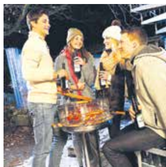
Für immer mehr Grillfans ist das ganze Jahr über Saison.