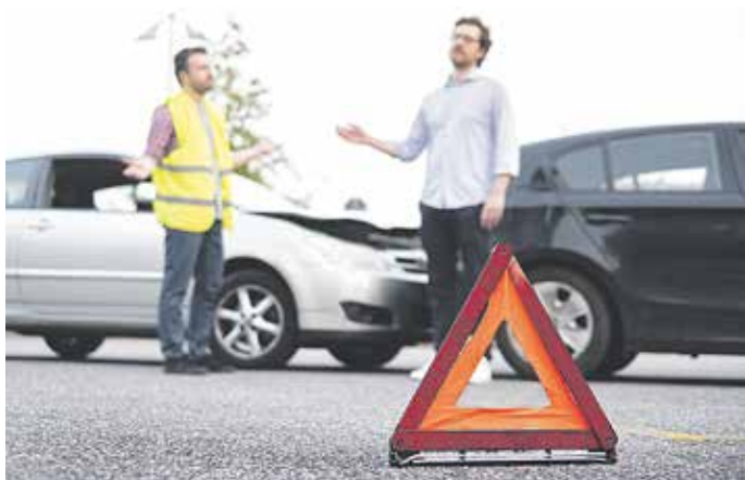
Bei einem Blechschaden kann es ausreichen, seine Daten mit den anderen Unfallbeteiligten auszutauschen und den Unfallhergang etwa mit Fotos oder einer Skizze zu dokumentieren.

(djd). Für die meisten Autofahrer ist ein Unfall auf der Autobahn ein besonderer Albtraum: Hier sind die Fahrzeuge mit hohen Geschwindigkeiten unterwegs, man kann nicht schnell rechts ranfahren und das Geschehen klären. Tatsächlich ereignen sich auf der Autobahn vergleichsweise wenige Karambolagen - aber wenn, dann oft mit schlimmen Folgen. Wer einen Unfall vor sich bemerkt, muss die Geschwindigkeit reduzieren, die Warnblinkanlage einschalten und für die Rettungsfahrzeuge eine Rettungsgasse bilden. Bei Missachtung drohen Bußgelder, Punkte in Flensburg und Fahrverbote. Wer in den Unfall direkt involviert ist, sollte Folgendes beachten: