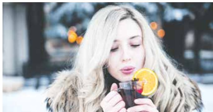
Wenn es draußen kalt ist, genießen wir eine Spezialität immer wieder gerne: den Glühwein.

(djd). Wenn es draußen kalt wird, genießen wir eine Spezialität immer wieder gerne: den Glühwein. Doch was zeichnet eigentlich einen guten Glühwein aus? Eine große Rolle spielt die Qualität des verwendeten Weins. So wird etwa der bekannte original Nürnberger Christkindles Markt-Glühwein von Gerstacker aus ausgesuchten Rebsorten hergestellt. Den besonderen Geschmack bekommt das Traditionsgetränk durch seine erlesene Gewürzmischung mit mehr als 25 Gewürzen. Diese Mischung wird für mindestens 36 Stunden in den hochwertigen Rotwein eingelegt, der speziell für den