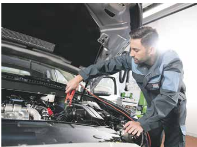
Eine regelmäßige Überprüfung der Batterie in der Fachwerkstatt beugt ärgerlichen Pannen vor.

Warum Batterien vor allem bei frostigen Temperaturen streiken, ist leicht erklärt. Bei Kälte laufen die chemischen Prozesse in ihrem Inneren langsamer ab, gleichzeitig sind die Belastungen beim Start besonders hoch. Wenn eine Batterie bereits etwas altersschwach ist, reicht ihre Kraft nicht mehr aus, um den Motor zu zünden. Häufig ist auch eine sogenannte Tiefentladung die Ursache für die Panne. Die vergessene Fahrzeugbeleuchtung, zusätzliche Verbraucher, ein Fehler in der Elektronik oder ein Kurzschluss können die gesamte Energie quasi über Nacht verbrauchen. Ohne externe Hilfe geht dann nichts mehr.