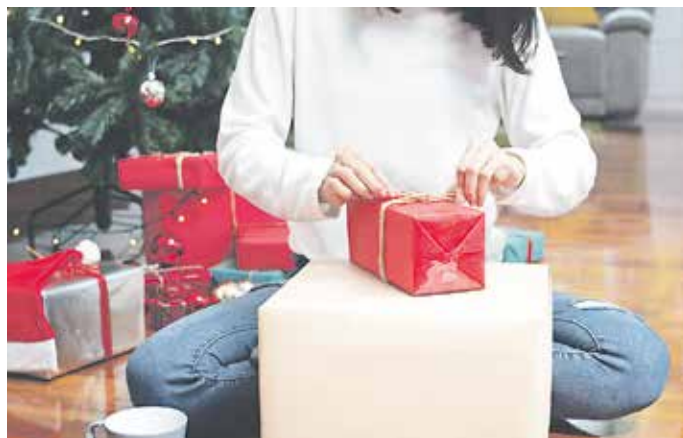
Von der Geschenkejagd bis zur Feiertagsplanung: Die Vorweihnachtszeit kann ganz schön stressig sein.