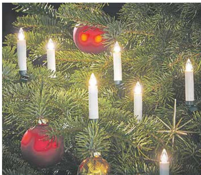
Die batteriebetriebenen Christbaumkerzen bringen jeden Weihnachtsbaum zum Strahlen - ganz ohne Brandgefahr.

In der dunklen Jahreszeit zaubern Kerzen, Lichterketten und beleuchtete Figuren sanftes Licht und eine kuschelige Atmosphäre. Teelichter können auf einem Teller aus Glas in Szene gesetzt werden, Lichterketten lassen sich in eine Dekoration aus Tannenzweigen integrieren, und beleuchtete Sterne im Fenster spenden angenehmes Licht. Klassiker der Weihnachtsbeleuchtung sind nach wie vor Kerzen. Ihr warmes Flackern sorgt sofort für festliche Stimmung, was sie vor allem auf dem Adventskranz unentbehrlich macht. Als Dekoration für den Christbaum jedoch sind echte Kerzen nicht mehr üblich. Gerade wenn Kleinkinder und Haustiere im Haus sind, die um den Baum herumtoben, ist das vielen zu gefährlich. Romantisch flackernden Lichtschein können allerdings auch batteriebetriebene Christbaumkerzen wie