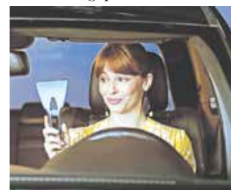
Der Eiskratzer hat ausgedient. Standheizungen machen das Scheibenkratzen überflüssig, eine Nachrüstung ist in jedem Auto möglich.

und Adressen von Fachwerkstätten. Standheizungen sind aber nicht nur im Winter von Vorteil: An heißen Tagen sorgen sie für einen schnellen Luftaustausch gegen ein Überhitzen des geparkten Autos.