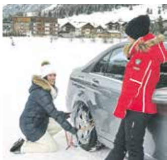
Auf vielen Alpenstrecken sind die Ketten bei winterlichen Straßenverhältnissen ohnehin vorgeschrieben, wer sich nicht daran hält, muss mit hohen Bußgeldern rechnen.

noch schnelleres und einfacheres Anbringen, die Verpackung wurde auf recycelbaren Karton umgestellt. Unter www.rud.com gibt es alle weiteren Infos.