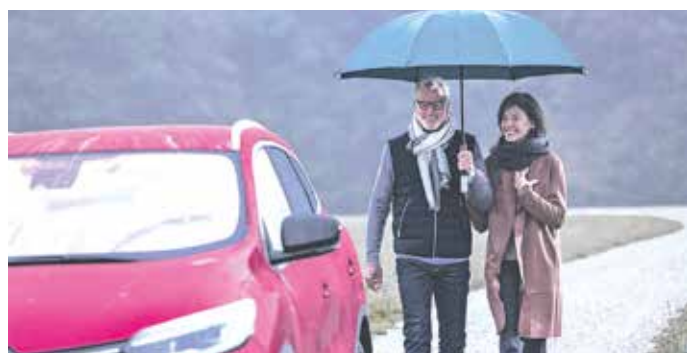
Eine Standheizung sorgt bei allen Wetterbedingungen für klare Scheiben und ein sicheres Fahren.

(djd). Dauerregen, Nebel, Straßenglätte, Schneematsch und schlecht Sicht: Die nasskalte Jahreszeit hält so manche unangenehme Begleiterscheinung für Autofahrer bereit. Bei diesen wechselhaften Bedingungen ist jederzeit die volle Konzentration am Steuer gefragt, beschlagene Scheiben und eine beeinträchtigte Sicht kann man sich jetzt nicht leisten. Standheizungen, die sich einfach in jedem Fahrzeug nachrüsten lassen, wärmen in den feuchtkalten Monaten von Oktober bis März nach Bedarf das Auto vor. Dabei entfeuchten sie die Luft im Fahrzeuginnenraum. Beschlagene Scheiben gibt es somit nicht mehr. Aber auch im Sommer sind die Anlagen nützlich für einen schnellen Luftaustausch. Unter www.standheizung.de gibt es mehr Informationen und Adressen von spezialisierten Fachwerkstätten.