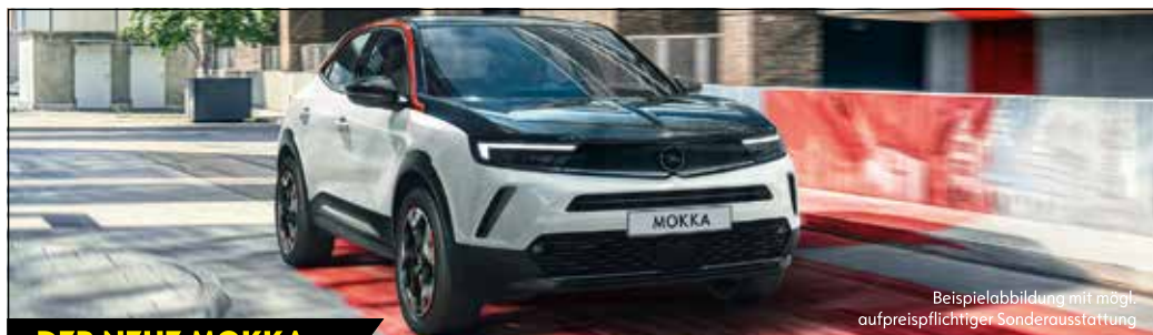
Beispielabbildung mit mögl. aufpreispflichtiger Sonderausstattung