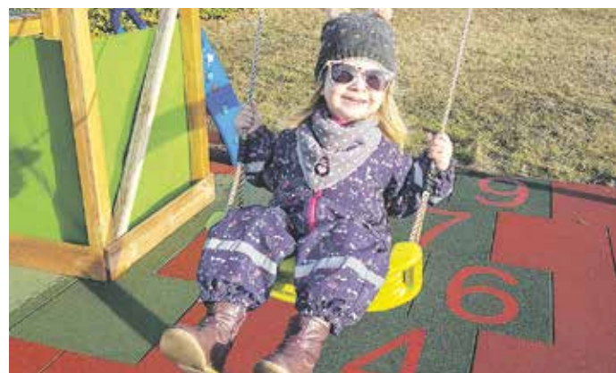
Wenn sie fällt, landet sie weich: Die sogenannten Fallschutzplatten bestehen aus ELT-Granulat, das aus Altreifen gewonnen wird.

Die Partner der Initiative New Life beispielsweise setzen sich für die stoffliche Verwertung von Altreifen ein: Aus ELT-