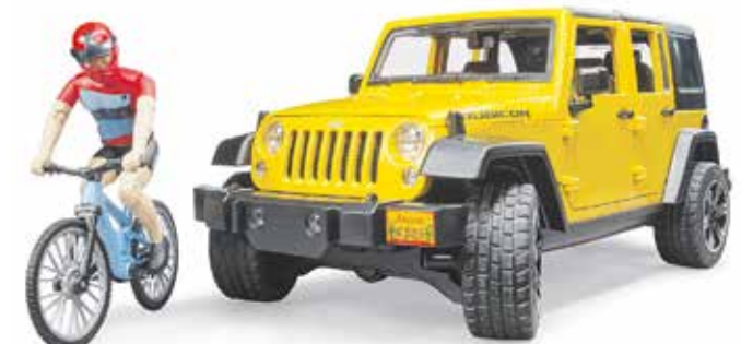
Zu den schönsten Mountainbikestrecken geht es mit dem Offroad-Fahrzeug Jeep Wrangler Rubicon Unlimited.