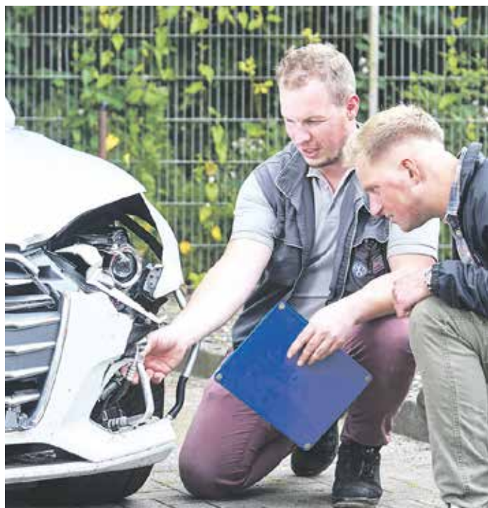
Beim Großteil der Unfälle bleibt es zum Glück bei Sachschäden.

den nie unerlaubt von einem Unfallort entfernen dürfe. Bei jedem Unfall mit Verletzten ist sofort der Rettungsdienst unter der Rufnummer 112 zu verständigen und die Unfallstelle ordnungsgemäß abzusichern. Verletzte sollten angesprochen und gegebenenfalls nach lebensrettenden Sofortmaßnahmen in die stabile Seitenlage gebracht werden. Wer nicht hilft, macht sich strafbar.