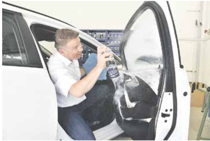
Für die Reinigung des Cockpits und der Verkleidungen eignet sich ein Mikrofasertuch in Kombination mit Cockpitspray.

- Der Motorraum bekommt ebenfalls über den Winter einiges an Verschmutzungen ab. Eine Motorwäsche sollte der Fachmann durchführen, um die empfindliche Elektronik nicht zu gefährden. Bei der Gelegenheit können Motoröl, Kühlwasser und Scheibenschwamm kontrolliert und nachgefüllt werden.