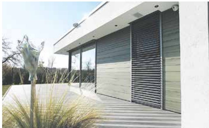
Paneele aus Naturfasern ermöglichen Fassadengestaltungen mit ansprechender Optik und hoher Energieeffizienz.

(djd). Für den ersten Eindruck gibt es keine zweite Chance. Das gilt auch für das Eigenheim. Die Fassade als äußere Schutzhülle und Visitenkarte des Gebäudes prägt entscheidend den architektonischen Stil und lässt auf einen Blick erkennen, wie gepflegt ein Haus ist. Neben der Optik kommt es aber auch auf die inneren Werte an, insbesondere auf Langlebigkeit, Witterungsbeständigkeit und Wärmedämmung. Neuartige Holzwerkstoffe verbinden diese Aspekte miteinander.