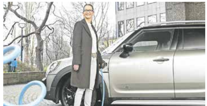
Elektroautos werden in Deutschland immer beliebter.

können Autofahrer auch bei der Versicherung. Wer sich für ein reines Elektroauto entscheidet und dieses etwa bei der DEVK versichert, zahlt 15 Prozent weniger für die Kfz-Haftpflichtversicherung. Ein Vorteil der Elektrofahrzeuge ist außerdem, dass sie weniger Wartung benötigen als Verbrenner. Allerdings kann nicht jede Werkstatt E-Autos reparieren. Hier sollte man sich vorab informieren.