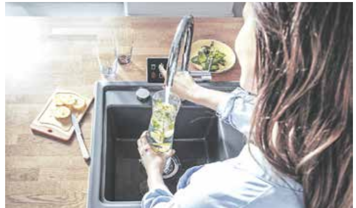
Einmal gekühltes Leitungswasser mit Sprudel bitte: Eine smarte Trinkwasserarmatur macht es möglich.

befüllt vorliegen. Unter www.rehau.de finden Interessierte unter dem Reiter „Trinkwasserarmatur“ eine Übersicht über die Funktionen unterschiedlicher Armaturmodelle. Der smarte Trinkwasserspender Re.Source beispielsweise wird in drei Varianten angeboten. Neben der Basisversion bieten die Premium-Versionen mit Touch Display auch Funktionalitäten wie Individualzapfmodi und Kindersicherung.