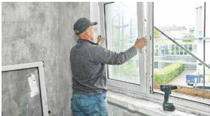
Alte Kunststofffenster werden ausgebaut und durch Modelle mit Recycling-Anteilen ersetzt.