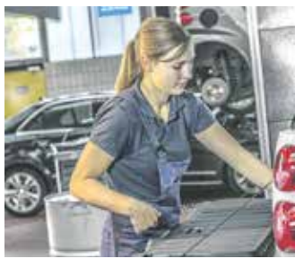
Der Berufseinstieg über eine Ausbildung im Kfz-Gewerbe bietet gute Entwicklungsmöglichkeiten und Aufstiegschancen.

(djd). Moderne Automobile werden immer mehr zum rollenden Computer, die Digitalisierung hat in den Autoberufen an vielen Stellen längst Einzug gehalten. Die Verbindung aus analoger und digitaler Welt ist sicher einer der Gründe, warum „was mit Autos“ auch bei der Generation Z, also den um die Jahrtausendwende Geborenen, hoch im Kurs steht und warum Ausbildungsberufe im Kfz-Gewerbe so beliebt sind.