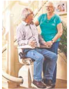
Im Alter können Treppen zu einem unüberwindlichen Hindernis werden. Ein Treppenlift hilft auf dem Weg nach oben.