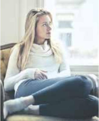
Lüftungssysteme mit Wärmerückgewinnung regeln automatisch den notwendigen Luftaustausch, wärmen die Frischluft vor und sparen Heizkosten.

Gegensteuern und sparen kann, wer auf erneuerbare Energien und eine energieeffiziente Haustechnik umsteigt. Lüftungssysteme mit Wärmerückgewinnung beispielsweise regeln automatisch den notwendigen Luftaustausch und wärmen die Frischluft vor. So muss bei kühlen Außentemperaturen deutlich weniger geheizt werden, wodurch sich die Heizkosten geräte- und gebäudeabhängig um etwa 30 Prozent reduzieren lassen. Unter www.wohnungs-lueftung.de gibt die Initiative „Gute Luft“ mehr Informationen zur modernen Technik und den Fördermöglichkeiten. Lüftungssysteme regeln automatisch den notwendigen Luftaustausch, ohne dass die Fenster geöffnet werden müssen. Dadurch wird verhindert, dass die Räume im Winter durch manuelle Fensterlüftung schnell auskühlen und langsam und teuer wieder aufgeheizt werden müssen. Lüftungsgerä-