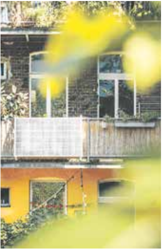
Die Balkon-Solaranlagen können selbst angeschlossen und angemeldet werden.

(djd). Eigenen Ökostrom produzieren und damit einen Beitrag zur Energiewende leisten: Mit einem sogenann-