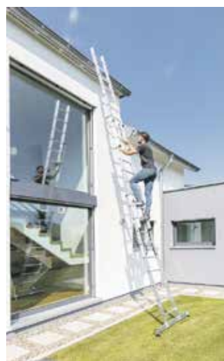
Mehrweckleitern lassen sich auch als sogenannte Anlegeleitern verwenden.

Holz wird mit Thermobehandlung widerstandsfähig Nachhaltiges Bauen beginnt mit der Auswahl natürlicher heimischer Materialien. Als Alternative zu Tropenholz aus fragwürdigen Quellen ist etwa Weißtanne eine gute Wahl für Terrasse, Fassade, Saunabau oder als Konstruktionsholz. Um die Langlebigkeit und Widerstandsfähigkeit des Naturmaterials zu steigern, empfiehlt sich vorher eine spezielle Veredelung. Beim Thermoholzverfahren, das aus Skandinavien bekannt ist, genügen konstant hohe Temperaturen, um die Robustheit deutlich zu verbessern. Die Rustika-Diele des Herstellers Swero etwa ist für den Dauereinsatz auf der Terrasse unter allen Witterungsbedingungen geeignet. Mit dem extrabreiten Format von über 26 Zentimetern und der unverfälscht natürlichen Optik machen die Holzdielen eine gute Figur. Mehr Infos gibt es unter www.swero.de .