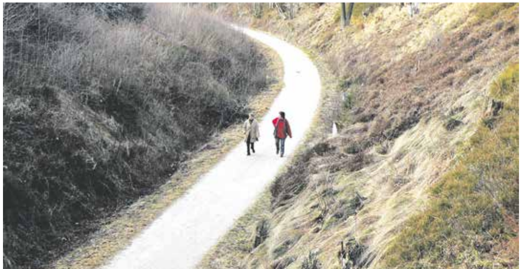
Blick in den Einschnitt des Radweges mit der Heide rechts und den Gehölzaufwuchs in Kirchenlamitz, Foto: Gudrun Frohmader-Heubeck

pen wird herausgepflegt und das seitlich gelagerte Strauchwerk beizeiten abtransportiert. Der Landschaftspflegeverband Wunsiedel bittet die Radfahrer und Spaziergänger die Sperrschilde zwischen der Staatsstraße Richtung Weißdorf und dem hinteren Bereich des Schwimmbades in Zeiten der Holzungen zu beachten und den Weg an den Werktagen zu meiden. Die Aktion ist zeitlich begrenzt, der Weg wird wieder geöffnet, wenn für niemanden Gefahr durch Fällungen von Bäumen quer über den Weg besteht. Die Biotoppflege zugunsten wärmeliebender Tierarten ist als praktischer Auftakt zugehörig zu dem gerade begonnenen Biodiversitätsprojekt „Kreuzottern im Fichtelgebirge“ des Naturparks Fichtelgebirge e.V.