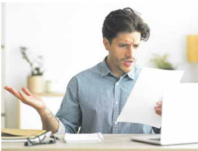
Ein böses Erwachen erleben derzeit viele Stromkunden in Deutschland: Der bisherige Anbieter liefert nicht mehr und man wechselt in die teure Grundversorgung.

„Nein, denn egal ob der Energieversorger insolvent ist oder nur die Belieferung einstellt, die Versorgung ist gesetzlich gesichert“, so Ralph Kampwirth vom Ökostromanbieter LichtBlick. Der Ablauf sei im-