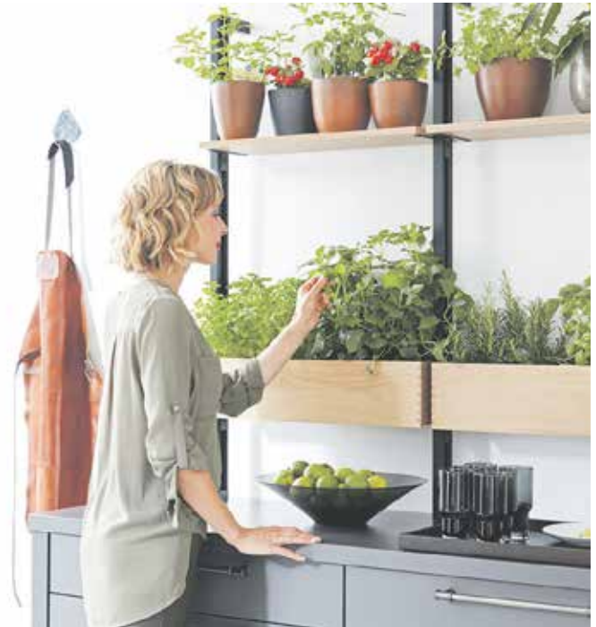
In einem Kräuterregal kann man Basilikum, Petersilie und Co. einfach selbst ziehen.

ker gibt es beispielsweise einen Wasserhahn, der auf Wunsch gekühltes, stilles und sprudelndes Wasser liefert. Wer Plastik vermeiden möchte, sollte zudem darauf achten, möglichst unverpackte Lebensmittel zu kaufen. Und auch bei Kleinigkeiten gilt das Prinzip der Nachhaltigkeit: Für Küchenhelfer wie Pfannenwender oder Schneidebrett kann man Modelle aus Holz wählen, Behälter für Wurst und Co. gibt es aus Glas. Ebenso wichtig ist es, den Abfall zu trennen und sorgsam zu entsorgen. So können einzelne verwertbare