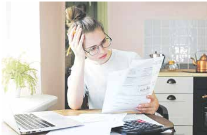
Das kann doch nicht wahr sein: Beim Blick auf die nächste Stromrechnung werden sich vermutlich viele Menschen erstmal an den Kopf greifen.

deren Waschmaschinen den Wasser- und Stromeinsatz der Wäschemenge anpasst: Ein voll beladenes Gerät wäscht immer noch am günstigsten und spart am meisten Energie. 3. Die Umstellung von herkömmlichen Glühbirnen auf Energiespar- und LED-Lampen amortisiert sich schnell. 4. Smart-Home-Technologien können nicht nur den Wohnkomfort erhöhen, sondern auch Strom- und Heizkosten deutlich absenken.