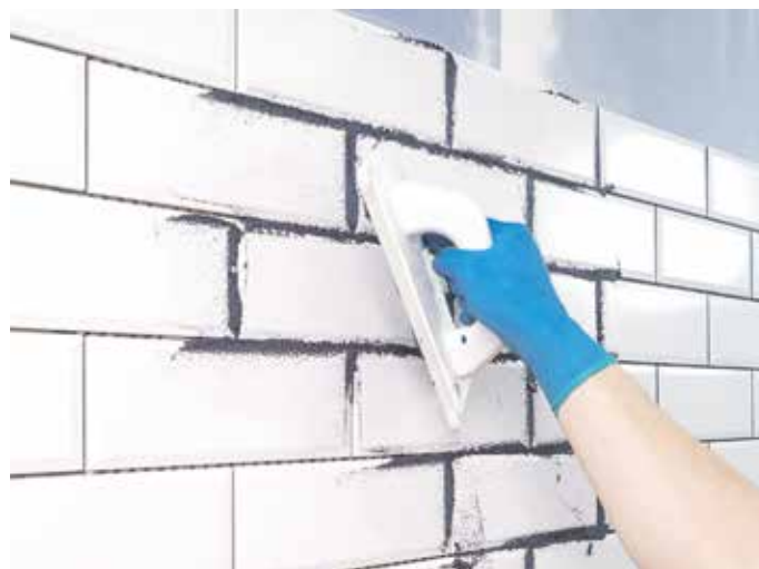
Feine Fugen: Mit den passenden Materialien lassen sich attraktive Fliesenflächen einfach selbst gestalten.

Erfahrene Heimwerker wissen, dass beim Verfugen noch einiges schiefgehen kann. Beim Anrühren der Fugenmasse kommt es auf die richtige Wassermenge und die Temperatur ebenso an wie auf das genaue Anmischverhältnis. Um es Selbermachen einfacher zu machen, gibt es heute Fugenmassen, die sich ganz unkompliziert verarbeiten lassen. Für Wand oder Boden, für Fliesen ebenso wie für Naturstein ist etwa die Flexfuge Universal von Knauf geeignet. Durch den hohen Anteil an Kalksteinmehl ist die Fuge besonders fein und kann selbst empfindliche Fliesenbeläge nicht zerkratzen. Mit 14 unterschied-