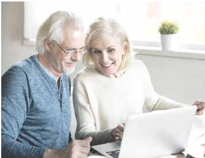
Experten erwarten in manchen Regionen mittelfristig sinkende Immobilienpreise. Wer verkaufen möchte, sollte sich daher rechtzeitig professionellen Rat einholen.

verkauf24. In zwei bis drei Jahren rechnen Experten jedoch mit stagnierenden, in einigen Regionen sogar mit fallenden Preisen. Wer einen Immobilienverkauf erwägt, sollte die Marktentwicklung im Auge behalten. Wichtig ist auch, den Wert der eigenen Immobilie zu kennen. Unter www.immoverkauf24.de/online-immobilienbewertung lässt sich der Immobilienwert einfach und kostenlos online prüfen.