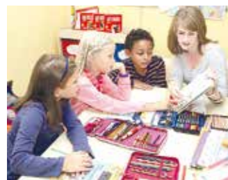
Viele Schüler und Schülerinnen wollen nach der Grundschule auf das Gymnasium gehen. Schon früh entsteht damit ein hoher Lernaufwand.

(djd). Knapp 750.000 Schülerinnen und Schüler werden im kommenden Sommer von der Grundschule auf eine weiterführende Schulform wechseln. Viele Familien haben dabei bereits das Abitur im Blick. Das zeigt eine aktuelle Forsa-Umfrage im Auftrag des Nachhilfeeinstituts Studienkreis unter 2.011 Eltern in Deutschland. 84 Prozent der Befragten stimmten der Aussage zu: „Mit Abitur hat man