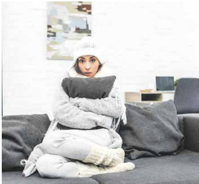
Wenn die Heizung bei winterlichen Minusgraden ausfällt, kann die schnelle Notfallhilfe durch den Handwerker richtig ins Geld gehen.

(djd). Gefühlt geschieht es immer am Abend, am Samstag oder Sonntag: Man sperrt sich aus der Wohnung oder dem Haus aus. Bei winterlichen Minusgraden versagt die Heizung ihren Dienst. Oder am Sonntag sind plötzlich Rohre oder die Toilette verstopft. Alle Ereignisse haben eines gemeinsam: Sie sind nicht nur ärgerlich, sondern ihre schnelle „Behandlung“ durch einen Experten kann richtig teuer werden. Das gilt für den Schlüsselnotdienst ebenso wie für den Heizungsservice. Die klassische Hausratversicherung kommt für solche Fälle nicht auf - als Ergänzung zur Hausratpolice kann deshalb ein sogenannter Wohnungsschutzbrief sinnvoll sein.