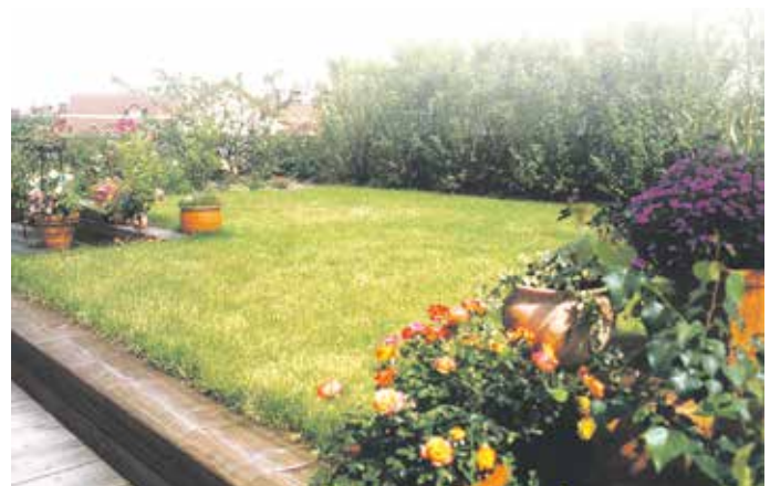
Den Platz bestens genutzt: Flachdächer lassen sich durch eine Begrünung optisch und ökologisch verschönern.

extensiven über die intensive Begrünung bis zur Gestaltung eines vollwertigen Biotops in luftiger Höhe. Von Anbietern wie Bauder gibt es Komplettsysteme für einen langlebigen und dichten Gründachaufbau. Die gesamte Planung und Ausführung sollte stets durch erfahrene Fachbetriebe erfolgen. Unter www.bauder.de sind mehr Infos sowie Ansprechpartner aus dem Dachhandwerk vor Ort zu finden.