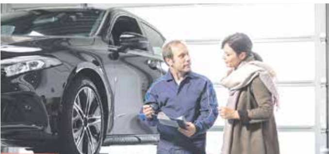
Auf der Hebebühne lassen sich die Spuren des Winters an Fahrgestell, Unterboden, Bremsen und Reifen genau unter die Lupe nehmen.

jahrs-Checks, zum Beispiel parallel zum anstehenden Umstieg auf Sommerreifen. Die Fachleute erkennen sofort, wie der Wagen den Winter überstanden hat. Auch Reifen, Flüssigkeitsstände sowie Lack und Frontscheibe werden überprüft. Wo Reparaturbedarf besteht, Flüssigkeiten zu ergänzen oder Teile auszutauschen sind, kann ein Kfz-Mechatroniker umgehend aktiv werden.