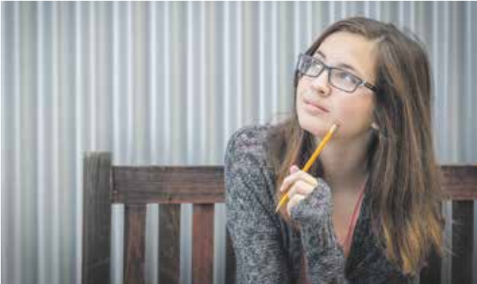
Schönheit liegt immer im Auge des Betrachters oder der Betrachteten: Davon ist eine überwiegende Mehrheit der Jugendlichen und jungen Erwachsenen in Deutschland überzeugt.

Beeinflussung durch soziale Netzwerke bei Mädchen und jungen Frauen stärker