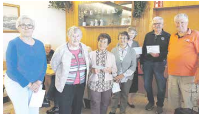
Jubilare 25, 30, 35, 40 Jahre