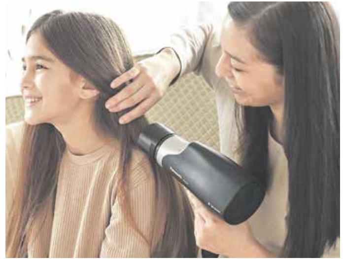
Beim Haarstyling entscheidet allein der persönliche Geschmack. Verschiedene Aufsätze für den Haartrockner helfen dabei.

Auch die Aufsätze, die mit dem Trockner mitgeliefert werden, fristen oftmals ein Schattendasein und liegen unberührt in der Verpackung. Dabei sind gerade sie hilfreich, um den Luftstrom richtig zu kanalisieren und unterschiedliche Styles zu verwirklichen. Schließlich hat jedes Familienmitglied eigene Ideen vom perfekten Look. Sie will ihr schulterlanges Haar in Form bringen und für viel Volumen sorgen. Er will seinen Shortcut schnell trocknen und das längere Haar auf dem Oberkopf dynamisch stylen. Und der Nachwuchs will vor der Schule den Bob richtig in Form bringen. Dafür müssen sich nicht mehrere Geräte im Bad stapeln. Praktischer und nachhaltiger ist es, mit nur einem Haartrockner alle Stylingwünsche zu erfüllen. Gleich drei Aufsätze gehören beispielsweise zum Lieferumfang des Panasonic EH-NA67: Neben der Schnell-trocknungsdüse gibt es einen Dif-