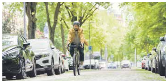
Fitter werden auf dem Weg zur Arbeit: E-Bikes sind für viele eine Alternative zum Auto oder öffentlichen Verkehrsmitteln geworden.

sönliche Fitness nachhaltig steigern. So zeichnet das smarte System von Bosch automatisch relevante Fahr- und Trainingsdaten auf. Für viele sind auch die persönlichen Anpassungen des E-Bikes auf die eigenen Bedürfnisse wichtig. Dank individuell einstellbaren Fahrmodi wird das Training noch effizienter.