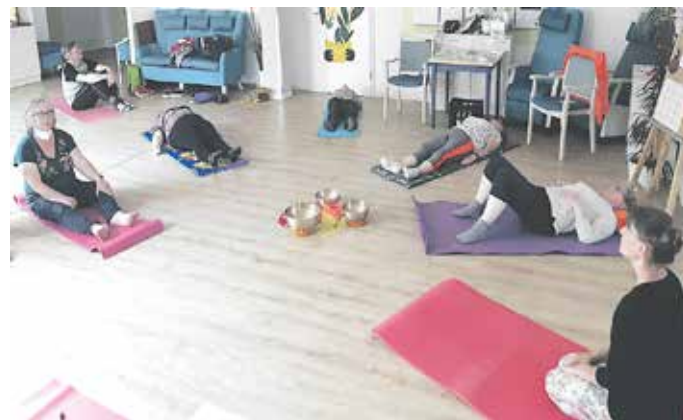
Verschiedene Entspannungsmethoden für den Alltag probierten die Teilnehmenden des Angehörigenforums bei der Rummelsberger Diakonie Rehau aus.

Rehau: „Woher soll ich noch Energie für mich selbst nehmen, wenn ich den ganzen Tag für andere da bin?“ – eine Frage, die sich viele pflegende Angehörige stellen. Daher bot die Fachstelle der Rummelsberger Diakonie Rehau einen Entspannungsabend an. Dabei wurden sieben verschiedene Entspannungsmethoden