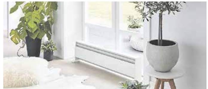
Eine E-Fußleistenheizung heizt den Wohnraum innerhalb kürzester Zeit auf und speichert die Wärme effizient.

Einbau einher. Für den Betrieb einer Elektroheizung ist dagegen lediglich eine Steckdose nötig. Neben den vergleichsweise niedrigen Anschaffungskosten können Nutzer klimaneutral bleiben - nämlich dann, wenn nur Grünstrom zum Einsatz kommt. E-Heizungen von Wibo heizen den Wohnraum innerhalb kurzer Zeit auf und speichern die Wärme effizient